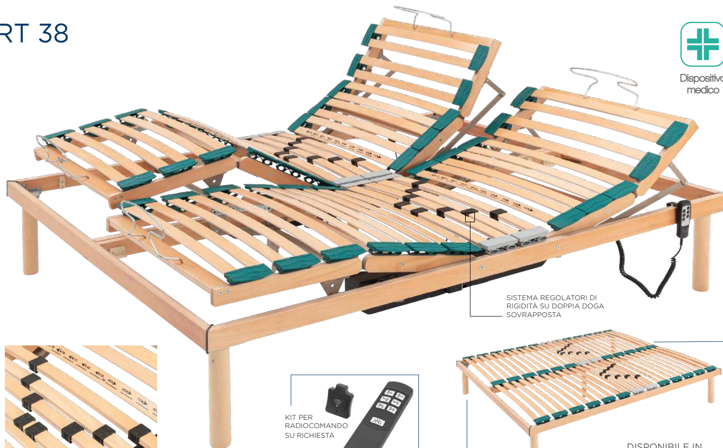
SISTEMA REGOLATORI DI RIGIDITÀ SU DOPPIA DOGA SOVRAPPOSTA

N° 4 per reti singole N° 5 per reti matrimoniali (4+1 piede di supporto centrale con regolatore)