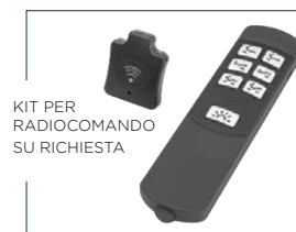
KIT PER RADIOCOMANDO SU RICHIESTA