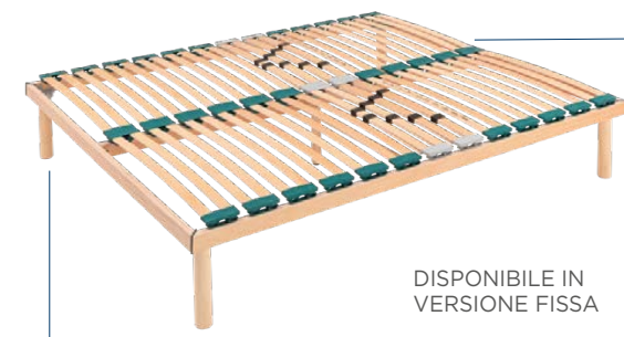
DISPONIBILE IN VERSIONE FISSA