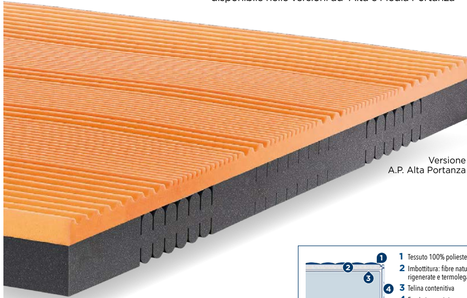
Versione A.P. Alta Portanza

disponibile nelle versioni ad Alta e Media Portanza