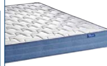
COVER FISSA Non sfoderabile Materasso finito H 19