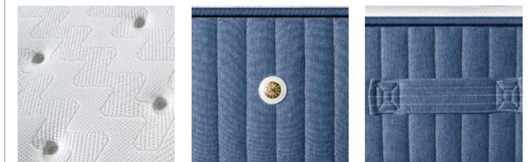
TESSUTO POLIESTERE+LYCRA TRAPUNTATURA PIAZZATA