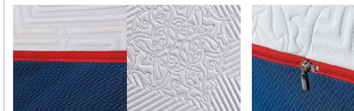
TESSUTI CON TRATTAMENTO SANITIZED