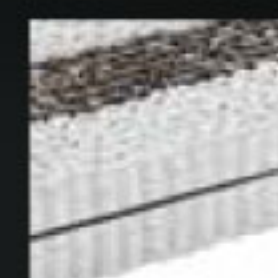
MICRO MOLLE INSACCHETTATE