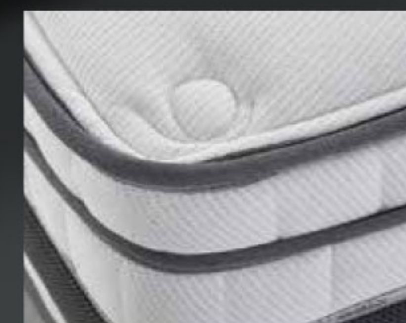
PARTICOLARE TOPPER FISSO